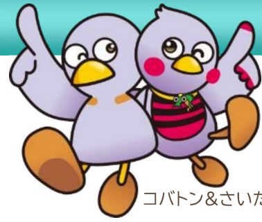
コバトン&さいたまっち